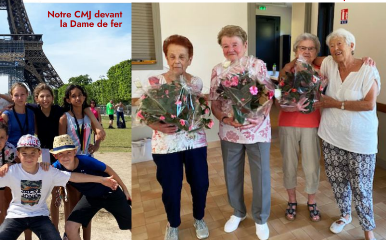
Les conscrites entourées de la présidente

Une première date est fixée au dimanche 27 novembre de 14 h à 17 h à la salle des rencontres (mairie).