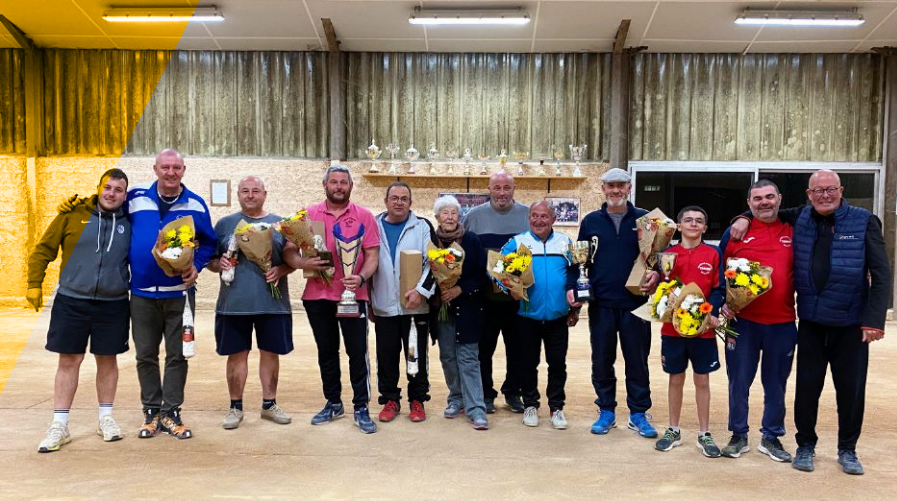
Les finalistes de la Coupe CORDIER