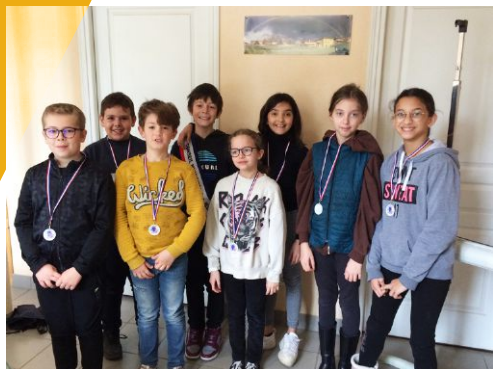
▲ Le nouveau CMJ

Les prochains ateliers visent à la mise en place de boîtes à livres à Billy et dans le bourg. Le CMJ compte sur vous pour les faire vivre !