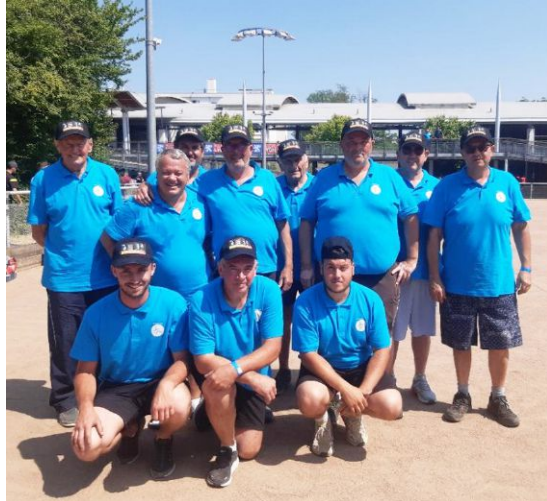
L'équipe Bois d'Oingt-Légny Finaliste du championnat du Rhône