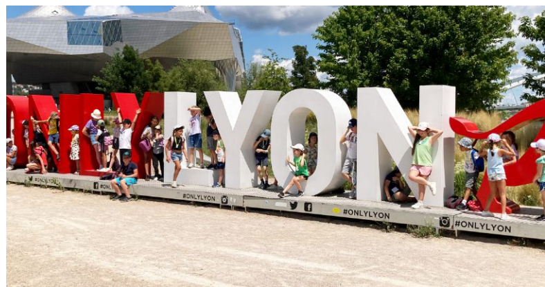
▲ Sortie de fin d'année au musée des Confluences à Lyon