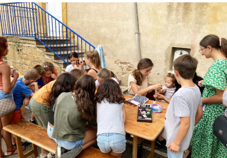
Atelier maquillage lors de la kermesse

Le bureau du Sou compte encore plus que jamais sur le soutien des parents et des Elginois tant dans leur participation aux actions proposées que dans l'organisation des événements.