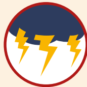
Risque tempête et orages