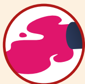
Risque transport de matières dangereuses par voie routière